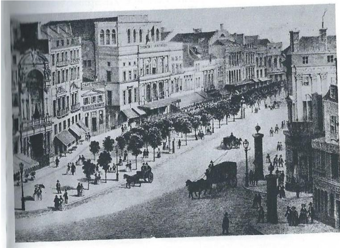
Rue du Temple in de tijd dat Flaubert er woonde.

"Op het platteland, bij Rouen, verblijft hij soms, gedurende de koude periode, 3 maanden zonder iemand te zien, staat op rond 12 uur, gaat slapen om 3/4 uur 's morgens. Zondags gaat hij dineren, brengt 4 uur door bij zijn broer." Hippolyte Taine. Sa vie et sa Correspondence Tome II, Le Critique et le Philosophe, 1853-1870.