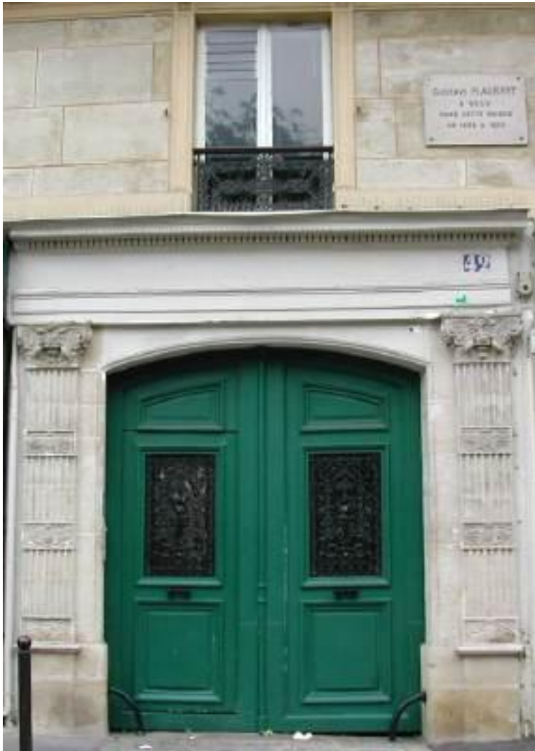
Entree woongebouw Rue du Temple 42