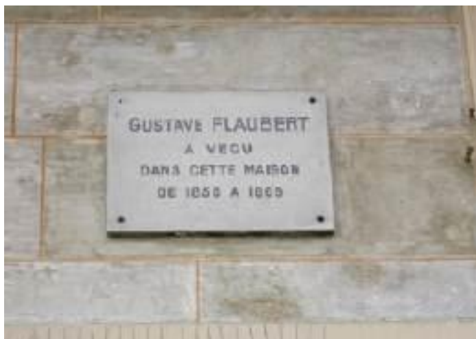
Gevelsteen Rue du Temple 42